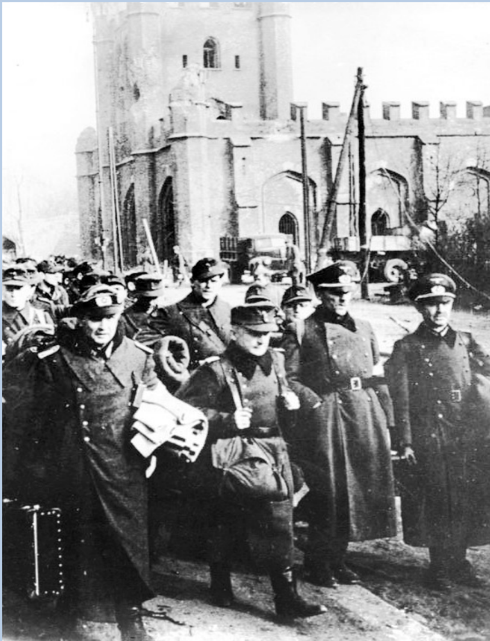
Пленные немецкие солдаты и офицеры у Королевских ворот Кёнигсберга. Фото

Среди наград, учреждённых в годы Великой Отечественной войны, есть только одна, которая посвящена взятию или освобождению не иностранной столицы, а взятию города-крепости. Речь идёт о медали «За взятие Кёнигсберга», которой были награждены 760 000 человек. Взятие Кёнигсберга — одна из самых ярких страниц в истории завершающего этапа Великой Отечественной войны. Гитлеровское командование многократно заявляло о неприступности столицы Восточной Пруссии.