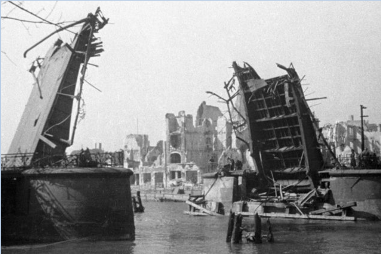
Кёнигсберг после взятия советскими войсками.