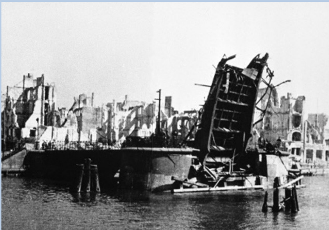
Разрушенный после боев мост в Кёнигсберге. Фото

В крепости были большие подземные склады и арсеналы, а также подземные заводы, выпускавшие военную продукцию. Словом, в Кёнигсберге были созданы все условия для длительной обороны.