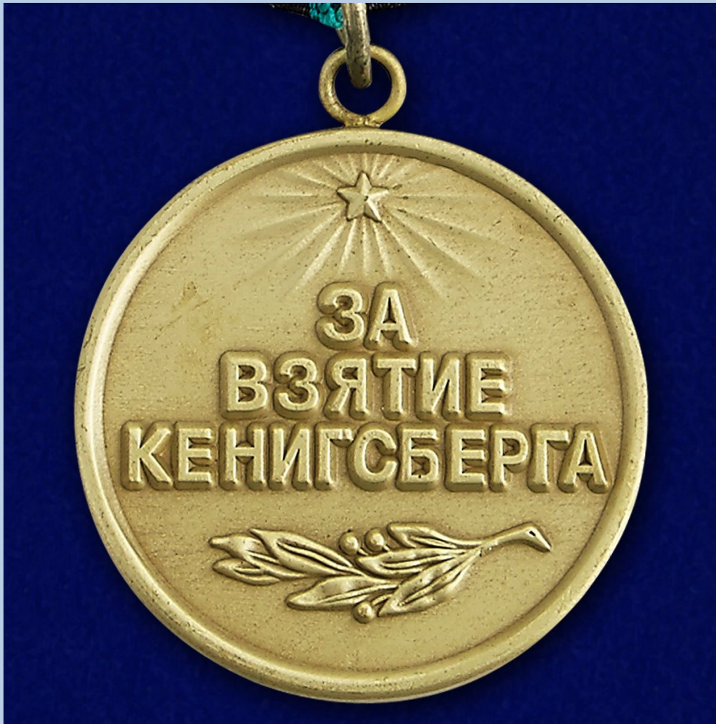
Медаль ВОВ «За взятие Кёнигсберга»