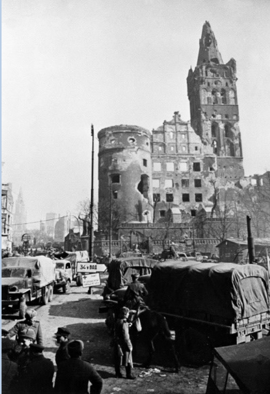
Части Советской Армии в немецком городе Кёнигсберге. 1945 г. Фото

В штурмовые группы привлекали в первую очередь тех, кто имел за плечами опыт уличных боёв, в частности участников Сталинградской битвы.