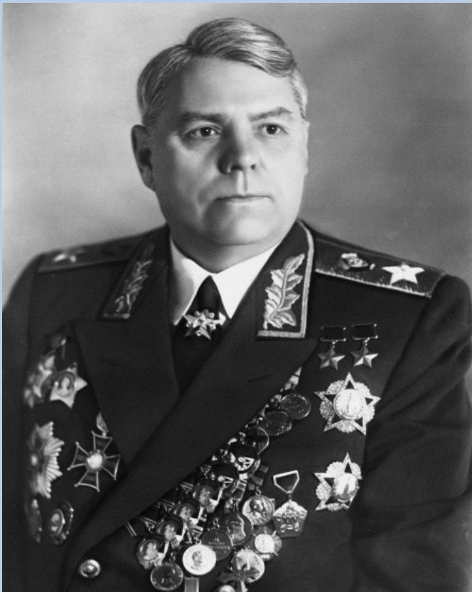
Дважды герой Советского Союза, Маршал Советского Союза Александр Михайлович Василевский. Фото

Интересно, что гитлеровское командование, вдохновляя своих солдат, апеллировало к... советскому опыту. «Русские, опираясь на слабые сухопутные укрепления Севастополя, защищали город 250 дней. Солдаты фюрера обязаны столько же времени продержаться на мощных укреплениях Кёнигсберга!», — восклицали нацистские пропагандисты.